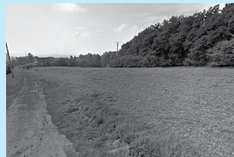
Do wydzierżawienia z przeznaczeniem na cele rolne: działka w rejonie ul. Dzikiej.

Szczegółowe ogłoszenie o przetargu zostało zamieszczone na stronie internetowej www.um.cieszyn.pl