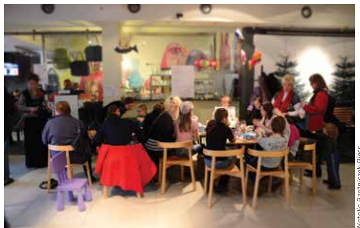
Warsztaty szycia karpia wzbudzają ciekawość co roku dużym powodzeniem.

Zapraszamy również na jedyny w swoim rodzaju KEKS – Kaloryczny-Energetyczny Kiermasz Świąteczny z oryginalnymi prezen-