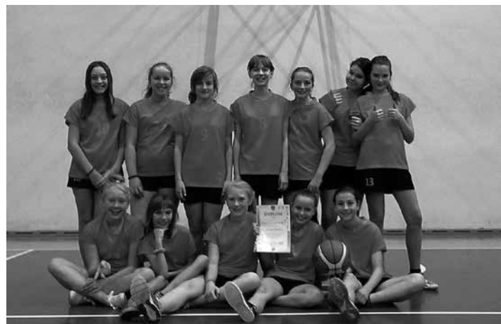
Drużyna minikoszykówki dziewcząt z SP1.