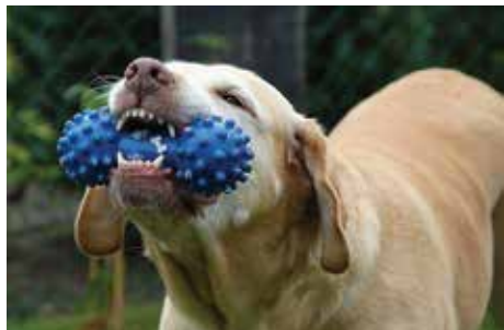
Czworonożni pupile ucieszą się zarówno z jedzenia, jak i z koców, smyczy czy misek.

Studenci Wyższej Szkoły Biznesu w Cieszynie organizują zbiórkę na rzecz psów i kotów z cieszyńskiego schroniska oraz dla podopiecznych z fundacji „Lepszy Świat”.