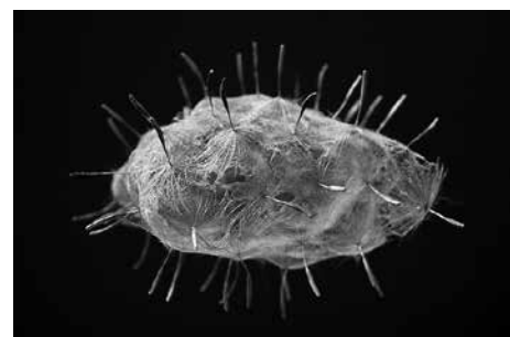
Praca Konrada Juścińskiego prezentowana na oryginalnej wystawie w Galerii Szarej.

Kolejna, po łódzkiej, odsłona maczuźnika, to selekcja prac jedenastu artystów młodego pokolenia, która wniknie w przestrzeń galerii. Poprzez zwielokrotnienie, zainfekowanie, przetworzenie i wtargnięcie – zbuduje nowy świat znaczeń i kontekstów. Odświeży zapas zużytych sensów, jak po deszczu!