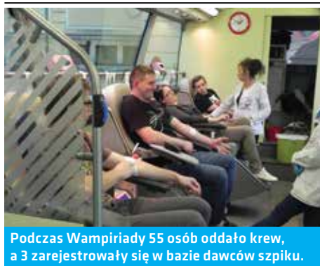
Podczas Wampirjadi 55 osób oddało krew, a 3 zarejestrowały się w bazie dawców szpiku.