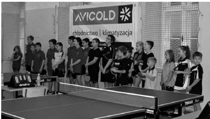
Zawodnicy walczący o Puchar Fundacji Talent Cieszyn.