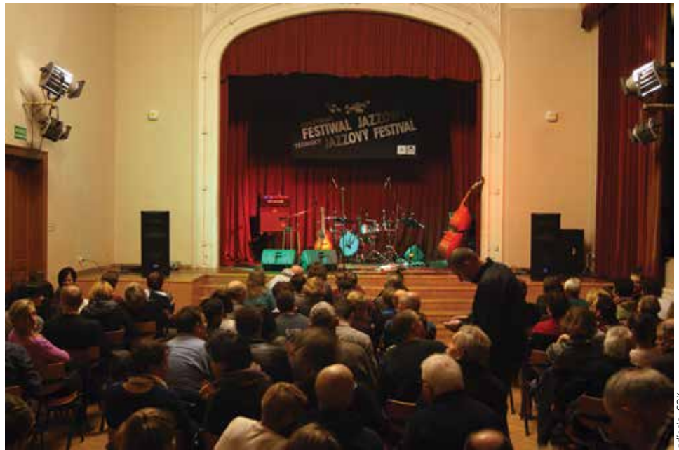
Publiczność dopisała – sala koncertowa Domu Narodowego pękła w szwach...