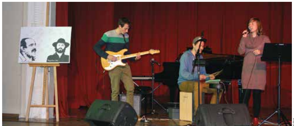
Elżbieta Kożuchowska Trio – zwycięzcy konkursu wokalnego „Ocalić od zapomnienia”.