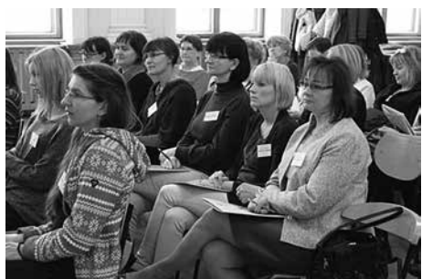
W konferencji udział wzięli pedagodzy szkolni, nauczyciele, pracownicy MOPS-u, katecheci i studenci.