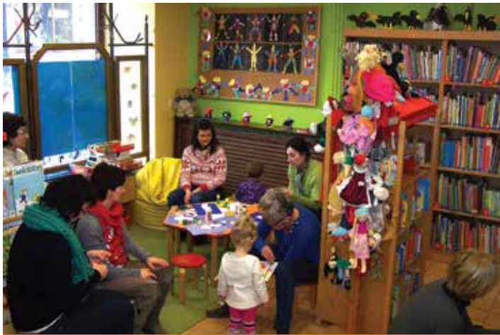
Biblioteka zaprasza rodziców i opiekunów do stworzenia „Gromadki Uszatka”.

Kierując się potrzebami środowiska lokalnego i chcąc poszerzyć bogatą ofertę zajęć prowadzonych w cieszyńskiej Bibliotece, pragniemy zaprosić rodziców i opiekunów naszych najmłodszych czytelników do stworzenia w dziale dziecięcym BM Grupy Zabawowej pn. „Gromadka Uszatka”.