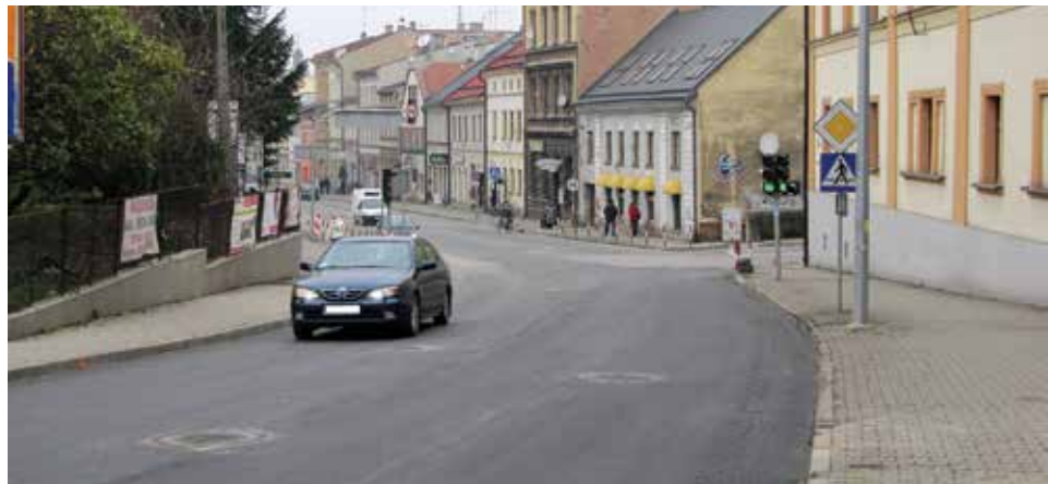
Zaasfaltowana ul. Górna i Zamkowa (poniżej).