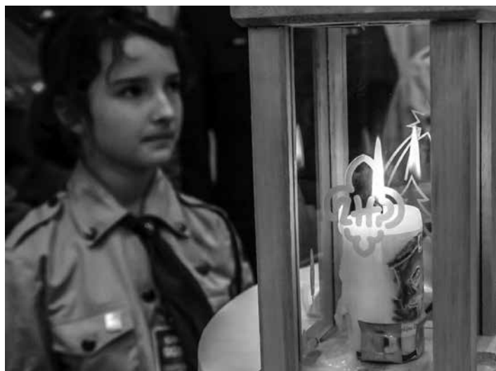
Harcerze Hufca Ziemi Cieszyńskiej wezmą udział w rejsie, by przekazać Betlejemskie Światło Pokoju skautom z Danii.

Życie na morzu zależy w dużym stopniu od natury, dla cieszyńskich harcerzy taka wyprawa to prawdziwe wyzwanie. Od dłuższego czasu przygotowują się pod kątem sprawności fizycznej,