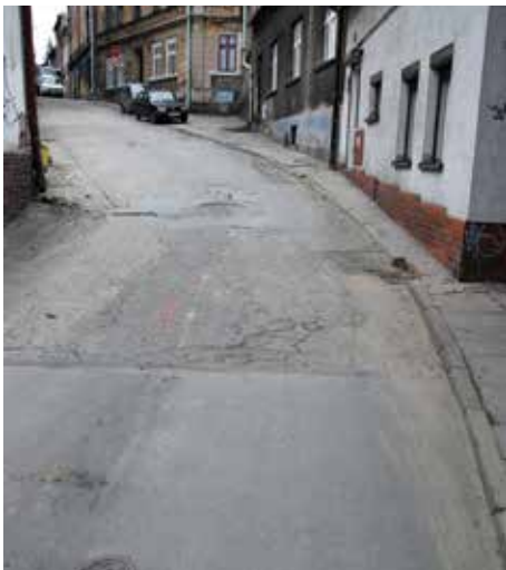
Ul. Śrutarska przed i po remoncie kanalizacji.