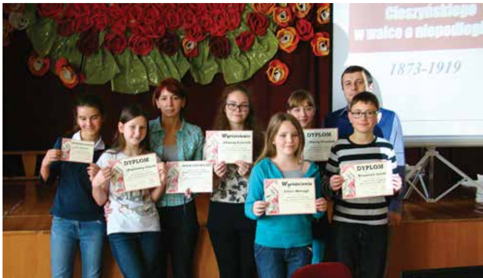
Zwycięzcy i wyróżnieni w konkursie historycznym dla uczniów cieszyńskich szkół podstawowych.